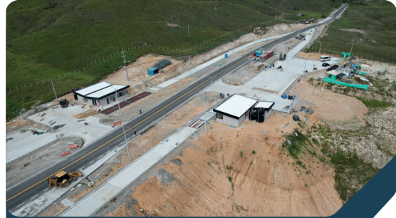
Zona de pesaje