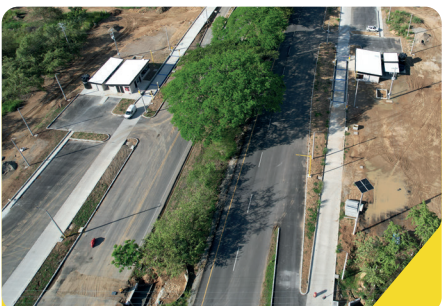
Zona de Pesaje