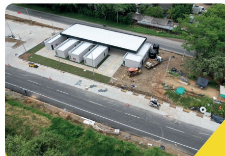
Área de servicio