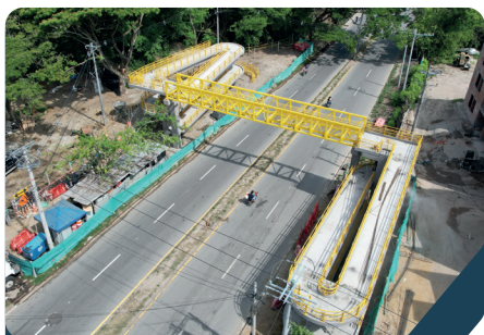
Puente peatonal Garzón