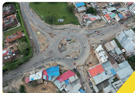
Intersección Gaviotas Pitalito