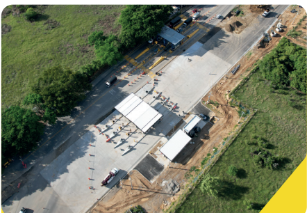
Modernización peajes Los Cauchos