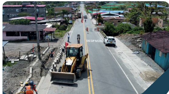
Andenes peatonales Villalobos