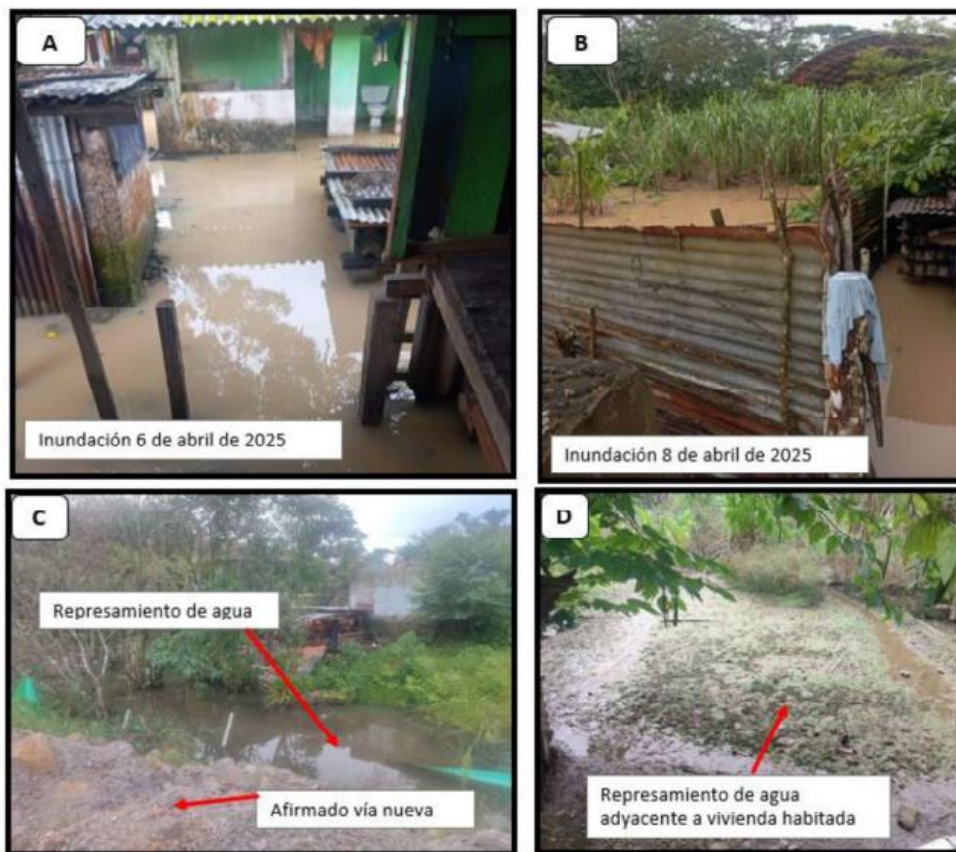
Ilustración 4. A- B. Inundación sobre viviendas barrio La Esmeralda. C. Intervención antrópica sobre humedal – represamiento de agua. D. Represamiento de agua.

Con la identificación del factor de riesgo, se acompañó la referencia fotográfica del fenómeno como se presenta a continuación: